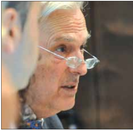
Juan de Dios Ramírez Heredia, presidente de Unión Romani