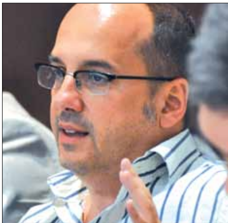
Carlos Campuzano, diputado por CiU en el Congreso de los Diputados