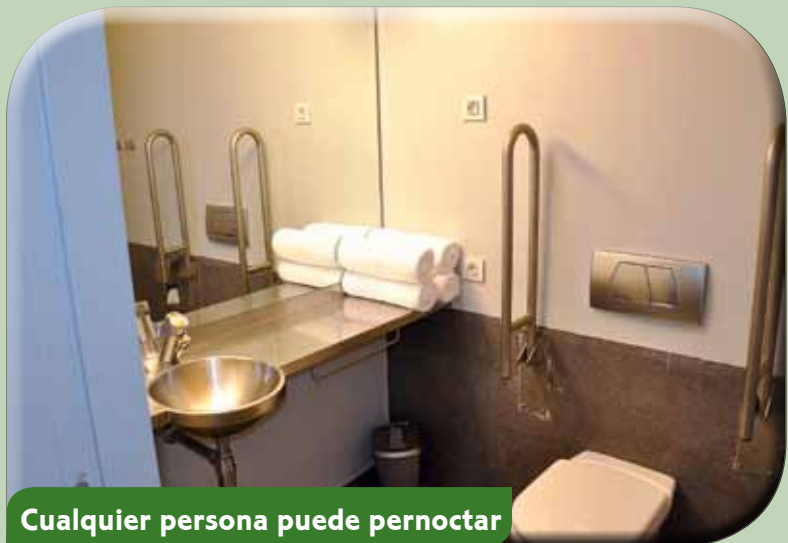
Cualquier persona puede pernoctar

Todo el albergue es totalmente accesible para cualquier persona. Desde los lavabos y duchas adaptados a todos los espacios comunes. Además, la señalización está en Braille y dispone de maquetas táctiles.