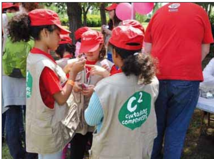
Los niños que participan aprenden a asumir responsabilidades

No es la primera vez que se elabora un material educativo que trata el tema de la participación desde la Fundación. Sin embargo, se hizo patente que era necesario retomarlo; ya que cuando los niños, niñas y jóvenes se comprometen en proyectos que van más allá de su satisfacción individual aprenden a ser ciudadanos y ciudadanas, a vivir en comunidad de una manera viva e intensa. Y también aprenden a madurar como personas, a asumir responsabilidades, a afrontar