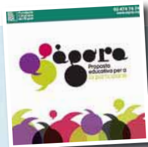
Se elaboraron materiales pedagógicos de la propuesta educativa "Ágora"

La participación es un proceso que requiere un aprendizaje, no surge de manera espontánea. Se da a partir de un entramado de relaciones y de la experiencia de vivir en colectividad, y comprende diferentes ámbitos: individual, grupo y comunidad. Es a través de cada uno de estos ámbitos que se incide de manera particular en los valores que estimulan el aprendizaje de la participación: la autonomía, la autogestión y el compromiso social.