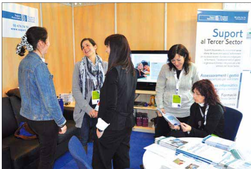
Estand de Suport en el III Congreso del Tercer Sector Social

Este año, Suport quiere dar un nuevo impulso al Club de Suport poniendo especial énfasis en el fomento de la participación de las entidades socias en cualquiera de