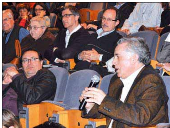
Después de la presentación del libro hubo diversas intervenciones de representantes de entidades del Tercer Sector

El acto finalizó con la proyección de un vídeo resumen de las cinco experiencias analizadas en el libro, proyectos todos desarrollados por entidades y considerados significativos en el ámbito de la inclusión social. ■