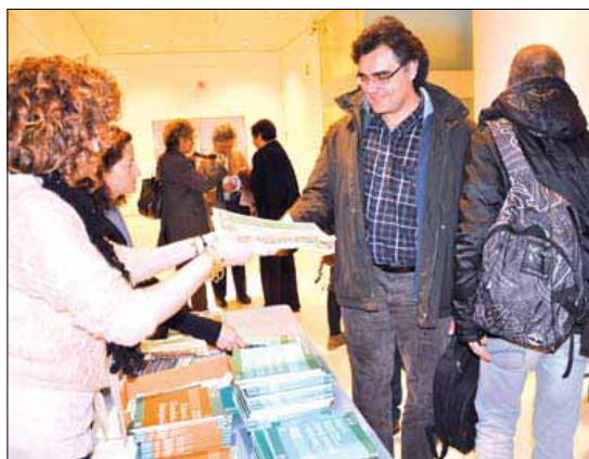
Se distribuyeron ejemplares a las personas que participaron en el acto