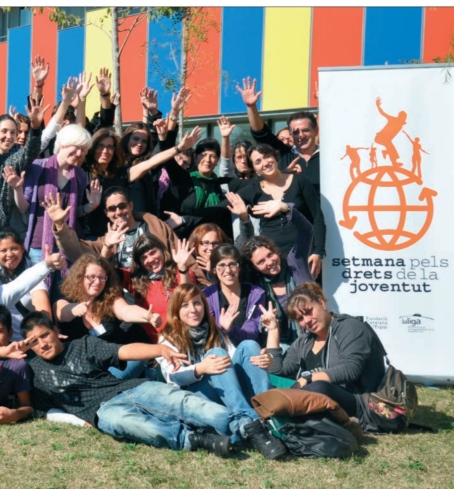
entud que se celebró en CENTRE ESPLAI.

políticos y al VI Encuentro Cívico Iberoamericano