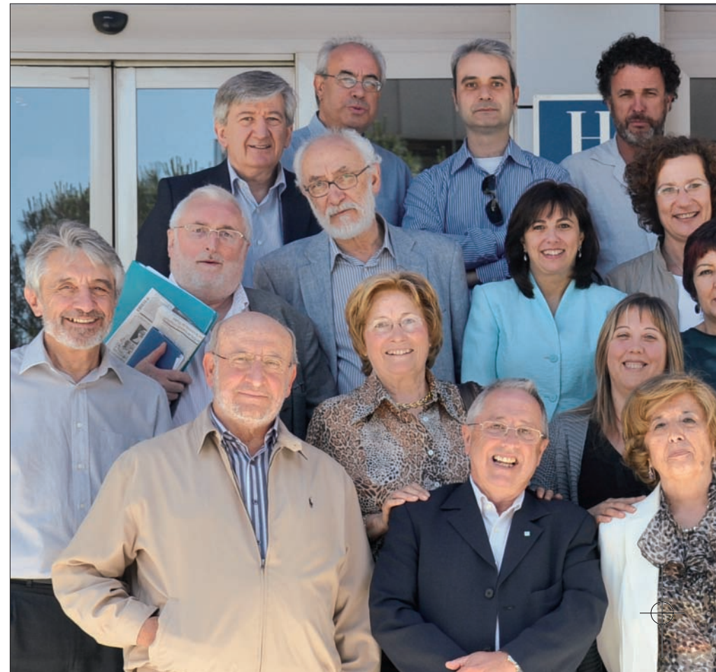
El Consejo Asesor en su reunión anual, la quinta desde que se constituyó. Además de rendir cuentas, los miembros del Consejo Asesor hacen aportaciones a los diferentes documentos que luego se convertirán en los libros de la colección.