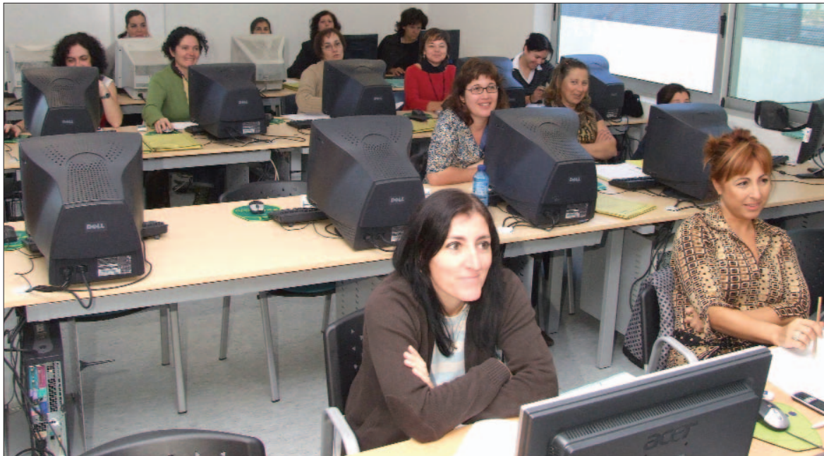
■ Las mujeres son uno de los colectivos diana a los que van dirigidas las acciones de inclusión laboral.

Centro Veciñal e Cultural de Valladares están dirigidas a personas en riesgo de exclusión laboral. Las acciones que se realizan van desde la consulta de revistas con ofertas laborales, a la creación de una base de datos de currículums de las personas que buscan empleo, pasando por la realización de entrevistas de orientación laboral, la selección de personas para trabajar en empresas que solicitan a la entidad estas incorporaciones y la alfabetización digital. Aquí es donde entra en juego el aula Red Conecta, que da diferentes servicios a los usuarios, como son la posibilidad de consultar páginas de Internet con ofertas de empleo y cursos para formar a los usuarios en el manejo de las nuevas tecnologías.