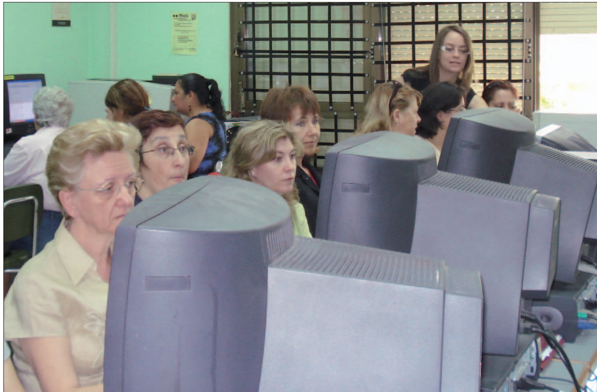
■ Las personas mayores son uno de los colectivos que más utilizan el aula Red Conecta.

La Asociación Vecinal "La Cornisa" trabaja entorno a seis ejes de acción para toda la población del barrio: Formación y Empleo; Servicios de orientación y ayuda mutua; Infancia y Juventud; Ocio y cultura;