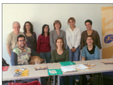
■ Firma del acuerdo entre el centro educativo y las entidades en septiembre pasado.

En octubre pasado, al iniciarse el curso 2007-2008, desde el "Punt