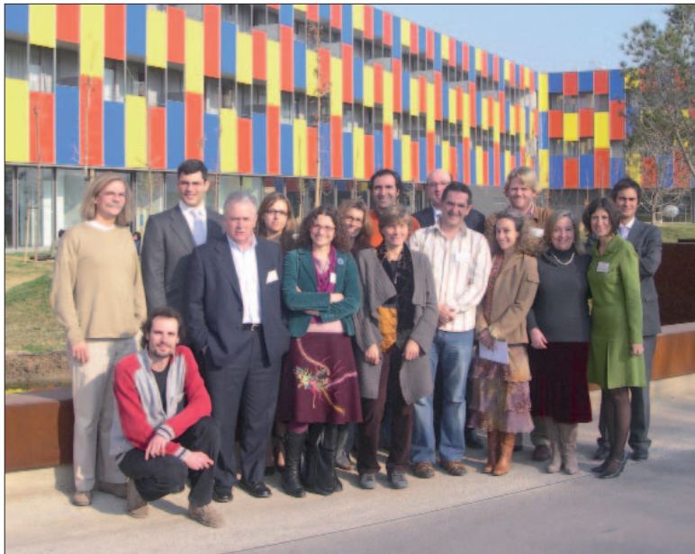
Asistentes a la jornada de trabajo.

Uno de los aspectos m s interesantes trabajados en la reuni n del d a