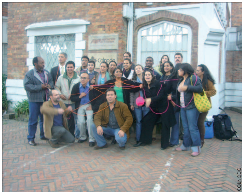
Grupo de Colnodo con los miembros de Fundaci n Esplai durante la formaci n realizada en Enero en Colombia.

La organizaci n colombiana Colnodo, en colaboraci n con Fundaci n Esplai y Telecentre.org, ha desarrollado del 23 al 25 de enero el proyecto "Academia Nacional de Telecentros", que busca mejorar el desempe o e impacto de los telecentros y fortalecer la red de telecentros en Colombia.