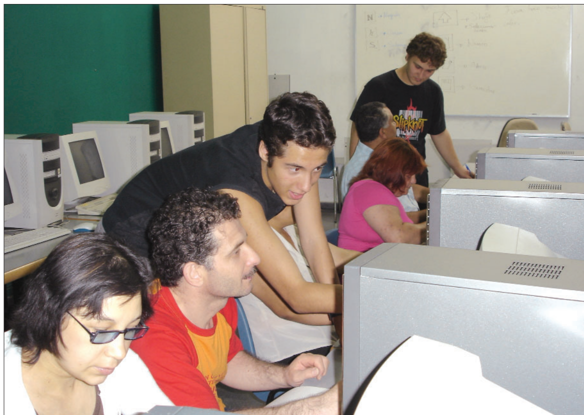
■ Este programa apuesta por la interrelaci n entre j venes y adultos.

esta manera, adem s, se potencia el trabajo en red entre entidades, una de las l neas de actuaci n que impulsa la Fundaci n Esplai.