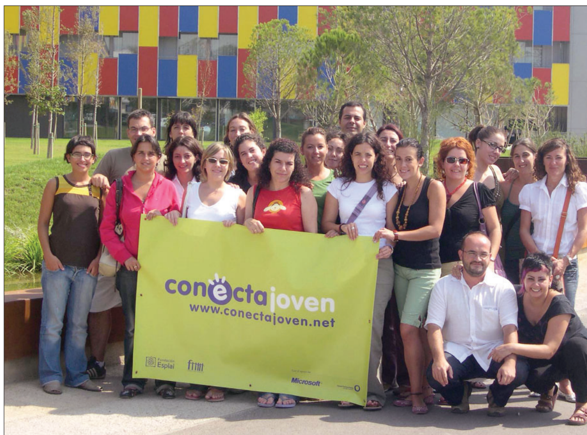
■ Responsables y dinamizadores del Conecta Joven se reunieron en CENTRE ESPLAI para formarse.

Este programa est  liderado por la Fundaci n Esplai y Microsoft que buscan en cada zona la colaboraci n de entidades y la administraci n p blica para desarrollar el proyecto a escala local, aunque con una metodolog a global. De