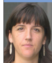
PEN LOPE PROVENZA Dinamizadora ABIERTO ASTURIAS AVIL S