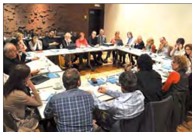
Sesión previa de trabajo. Las presentaciones del libro han sido precedidas de sesiones de trabajo y debate, como la de la foto, celebrada en Madrid.

las aportaciones públicas, retraso en los pagos, disminución de las colaboraciones privadas y reducción del crédito bancario. Es momento, ante todo, de sobrevivir y saber navegar en esta "tormenta perfecta". El tercer sector necesita todo el apoyo de manera urgente.