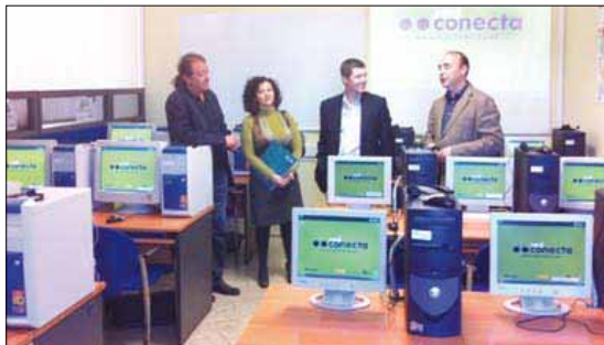
De izquierda a derecha y de arriba a abajo, inauguraciones de Conecta en Cabezo de Torres (Murcia); Burjassot (Valencia); Ayerbe (Huesca) y Barcelona