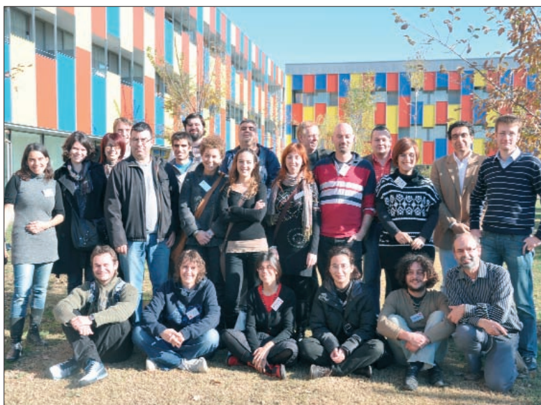
Participantes en las jornadas celebradas en el Prat de Llobregat

En este Workshop de noviembre se acogió a todos los tutores del proyecto con el fin de presentar la plataforma virtual con la que trabajarán, además de formarlos en la metodología e-learning que lleva-